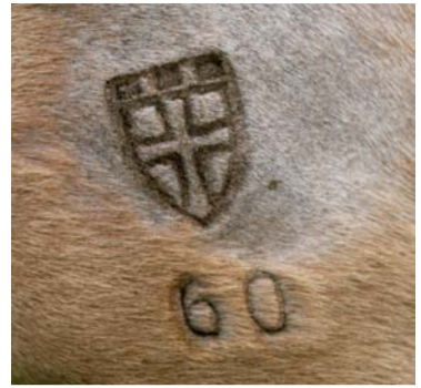
Deutsche Zuchtverbände dürfen zusätzlich zum Chippen weiterhin brennen – in Dänemark ist der Heißbrand jetzt verboten.

Die Zuchtverbände konnten sich nicht durchsetzen: Trotz ihrer Proteste gilt auch in Deutschland seit Juli 2009 eine neue EU-Richtlinie, die eine Kennzeichnung von Pferden mit einem Mikrochip vorschreibt. Alle ab 2009 geborenen Pferde und solche, die bis dahin keinen Equidenpass hatten, bekommen einen etwa reiskorngroßen Chip unterhalb des Mähnenkamms unter die Haut gesetzt. Sie sind lebenslang unter der im Chip gespeicherten 15-stelligen Nummer eindeutig zu identifizieren. Und zwar auch, wenn sie zum Schlachter gehen: Anhand der Nummer lässt sich eindeutig feststellen, welche Medikamente sie erhalten haben und ob sie überhaupt in die Lebensmittelkette gelangen dürfen.