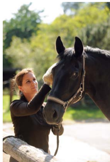
Wenn die Beziehung zwischen beiden stimmt, tun Pferde für ihre Menschen alles.

Kinder wachsen früh in den Turniersport hinein, und das nicht selten auf die harte Tour. Wenn ein Kind von der ehrgeizigen Mutter nach einem verpassten Sieg nur böse Blicke erntet statt eines Lobes für den guten Ritt und die schönen Galoppzirkel, wird es solche Härte ganz sicher weitergeben an sein Pferd. Zählt nur noch Leistung, kann ein Kind sich Selbstachtung und auch die Achtung anderer nur durch Siege erarbeiten, dann werden auch Pferdewechsel und harte Trainingsmethoden, Schlaufzü-