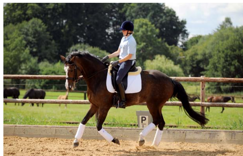
Der lange Weg zur Kandarenreife wird heute leider oft auf Kosten des Pferdes abgekürzt.

gel und Rollkur nicht ausbleiben, wie sie ja von Reitlehrern und Spitzenreitern vorgelebt werden. Ergebnisorientiertes Reiten ersetzt den achtsamen Umgang mit einem hochsensiblen Tier, das nachweislich Gefühle hat wie jeder Mensch.