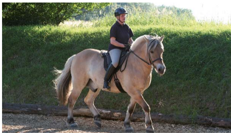
Völlig unabhängig von Reitweise oder Disziplin bewirkt das Centered Riding Entspannung, klare Körpersignale und mehr Achtsamkeit.

„Sanfte Augen“, das bedeutet: ein weicher, weiter Blick, bewirkt eine veränderte Wahrnehmung, weniger Spannung und mehr Freiheit und Leichtigkeit in der Vorwärtsbewegung. Die Interaktion zwischen Reiter und Pferd wird stärker erfüllt.