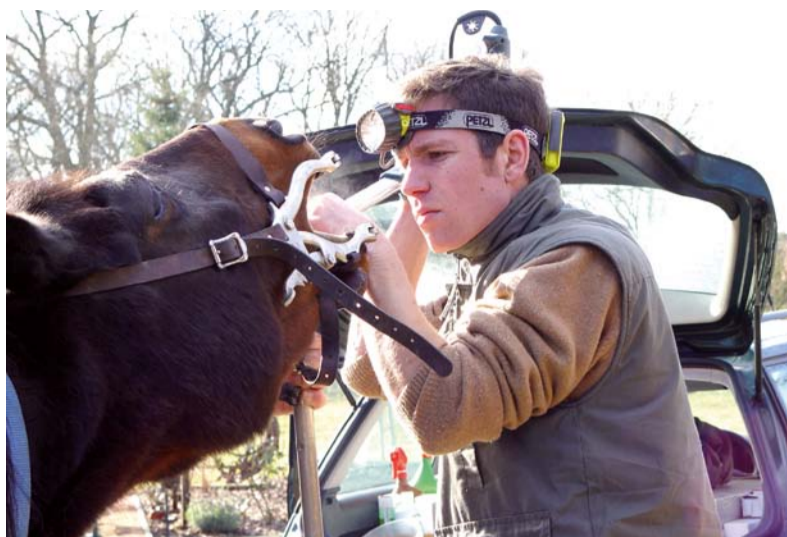
Die Zahnbehandlung von Pferden gehört zur Routine von Tierärzten in Großtier- und Landpraxen.

Paragraph 1 der Bundestierärztereordnung beschreibt den Beruf recht genau: „Die/der Tierärztin/Tierarzt ist berufen, Leiden und Krankheiten der Tiere zu verhüten, zu lindern und zu heilen, zur Erhaltung und Entwicklung eines leistungsfähigen Tierbestandes beizutragen, den Menschen vor Gefahren und Schädigungen durch Tierkrank-